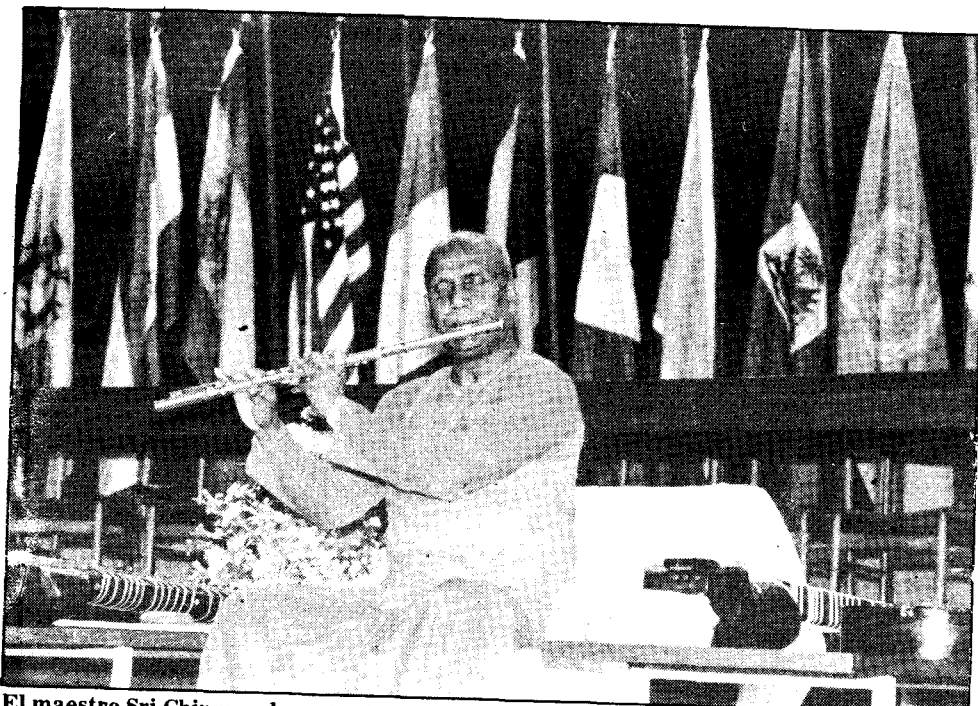
El maestro Sri Chinmoy durante el concierto que ofreció en el local de las Naciones Unidas en Santiago. Asistieron a este recital personalidades del mundo diplomático.