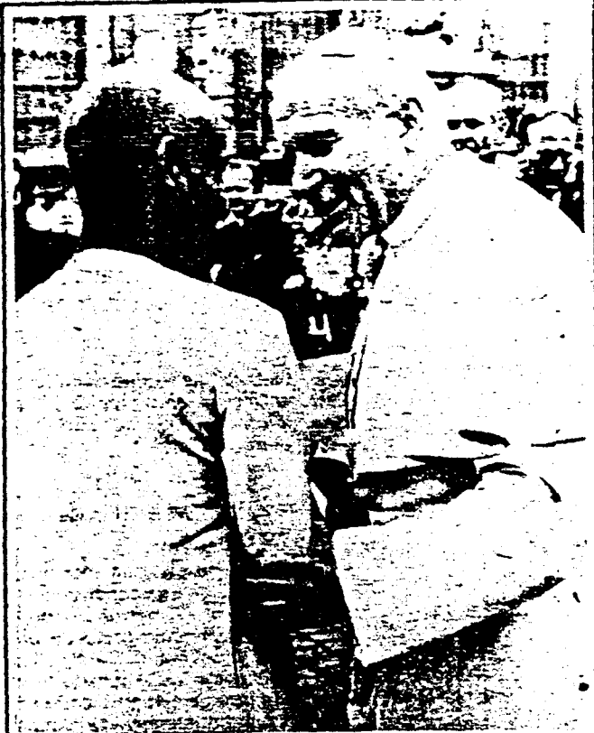
Líder de la paz mundial ha sido llamado Sri Chinmoy, quien fue recibido por el Papa Juan Pablo II el 18 de junio de 1980, según se aprecia en la fotografía, captada en El Vaticano. Ahora, se encuentra en Viña del Mar.