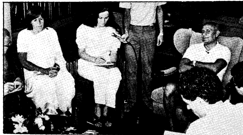
Sri Chinmoy, durante la conferencia de prensa ofrecida ayer, en la cual informó de los fines y propósitos de su grupo, la razón por la cual resolvieron visitar Valdivia y su amplio programa de interesantes actividades en nuestra ciudad.

Respecto de la despedida que le hicieron